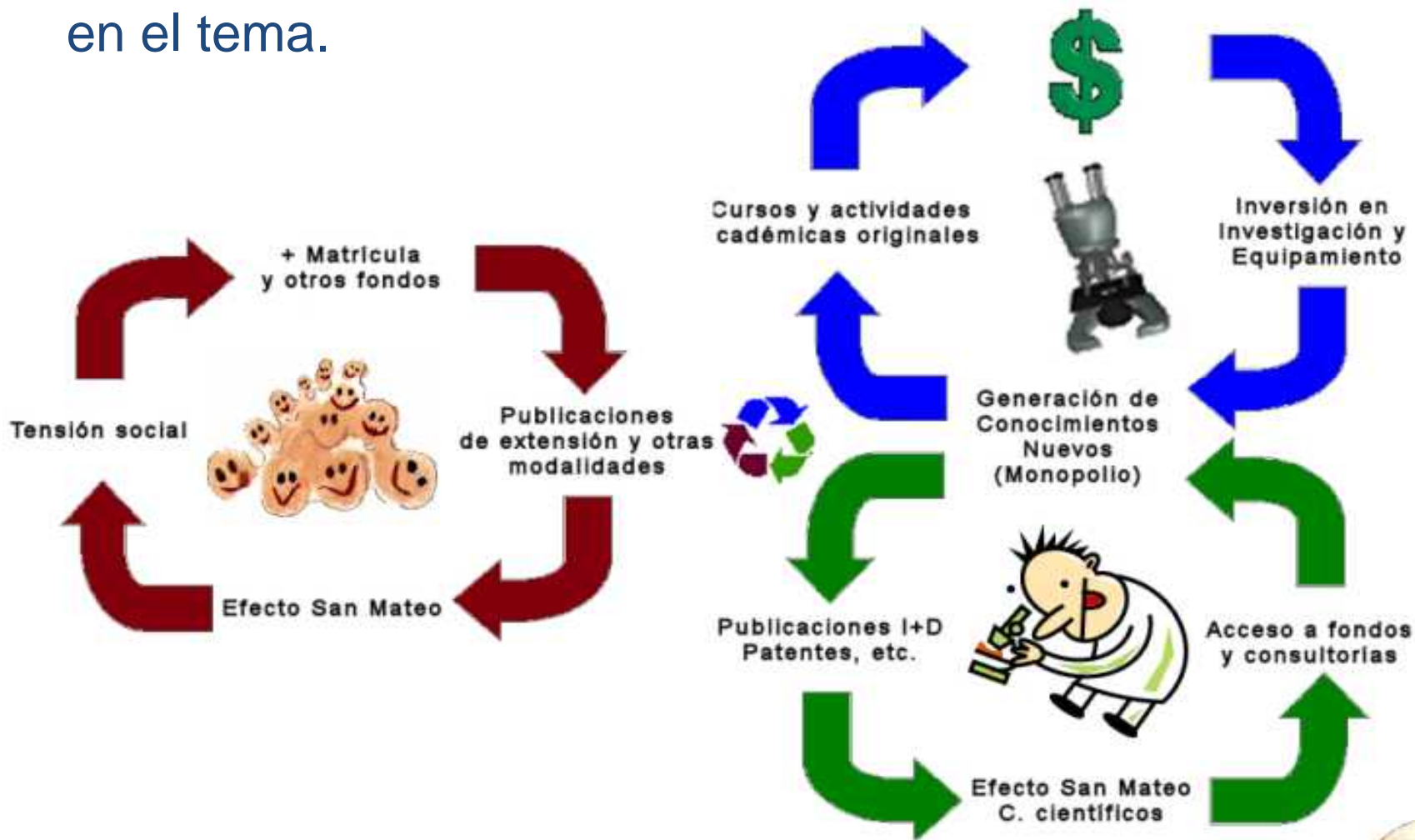
Flujograma (Extremadamente simplificado) del funcionamiento del programa de generación de fondos (© E. Richard 2007) del paradigma productivo.

La idea es ofrecer cursos (grado, postgrado, actualización profesional y extensión comunitaria - efecto San Mateo) de temas en los que los docentes son referentes reconocidos en el tema.